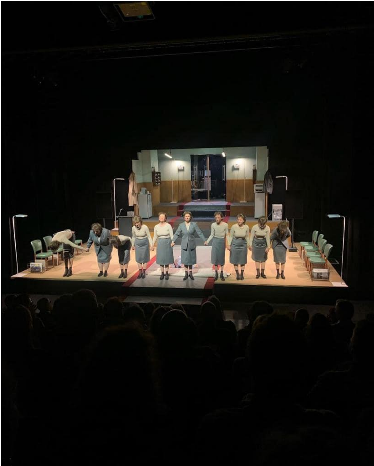
EWS – DER EINZIGE POLITTHRILLER DER SCHWEIZ